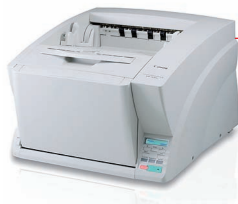
De DR-X10C kan een batch met verschillende documentformaten in 1 keer verwerken

De innovatieve nietjes detectie van Canon stopt onmiddellijk met de invoer zodra een nietje is gedetecteerd. En voorkomt dat beschadiging aan de scanner of aan het document kan optreden.