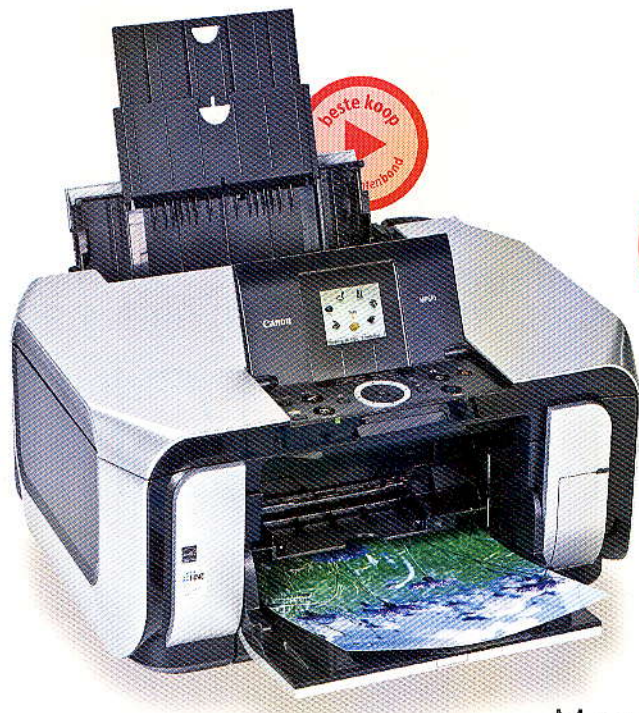
Canon PIXMA MP610