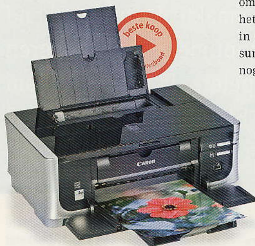
Canon PIXMA iP4500

Beter is een systeem met losse kleurencartridges. Twee modellen hebben zelfs vijf kleurencartridges. Meer kleurencartridges is niet per se beter. De Epson Stylus Photo RX585 heeft vijf kleuren en toch een matig oordeel voor fotokwaliteit.