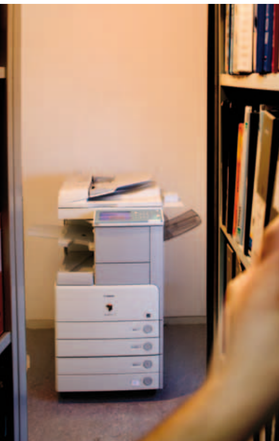
De iR3025 bij de documentatieruimte