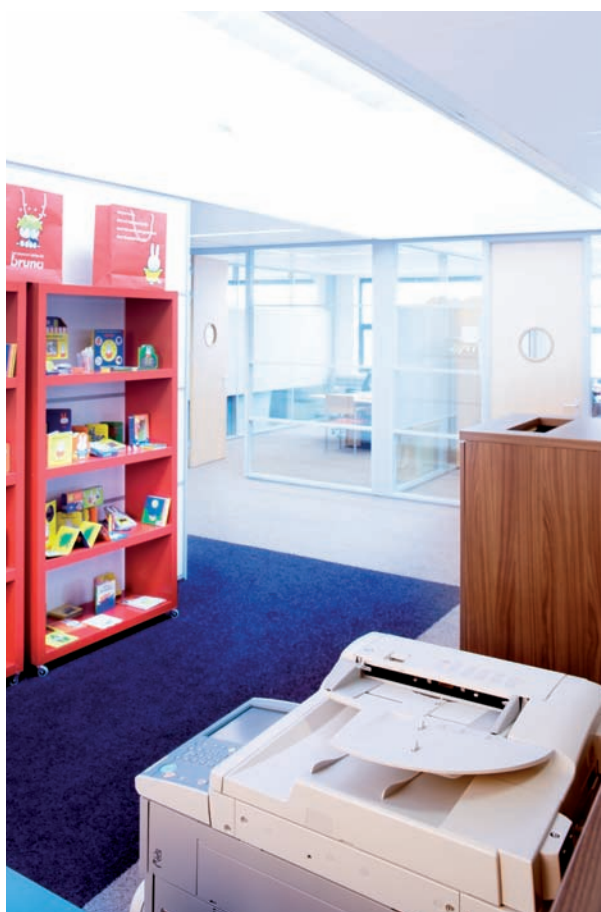
Centrale opstellingen ondersteunen alle afdelingen bij het dagelijks werk