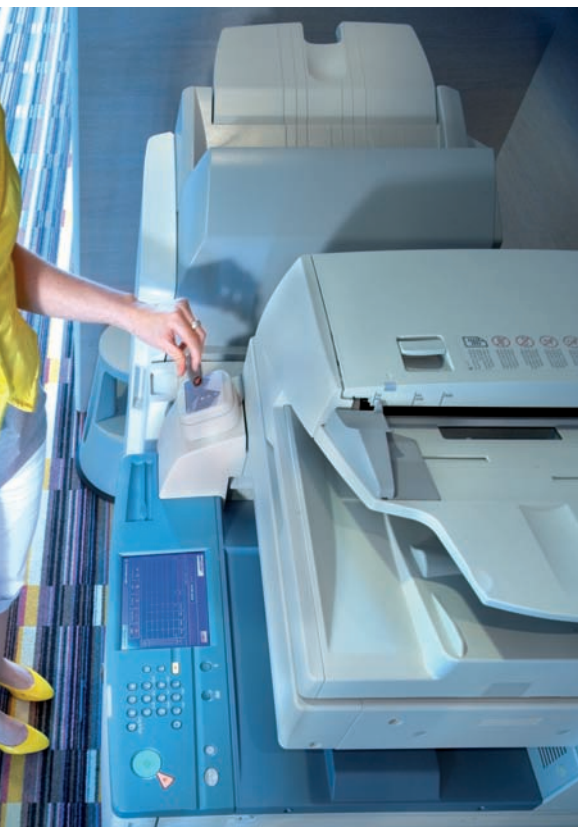
Multifunctional met identificatiesysteem Toegang tot alle persoonlijke functies met de Aramis huispas