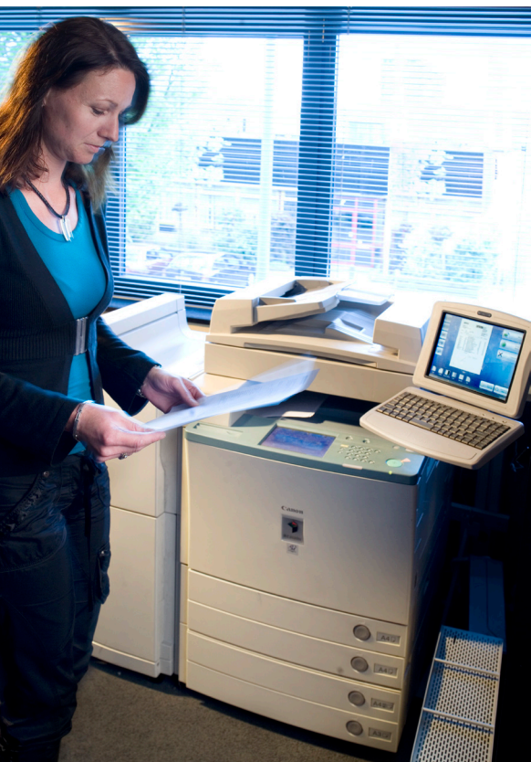
iR3035 met eCopy Scanstation Documenten direct in ADOS scannen, mailen en haarscherp printen