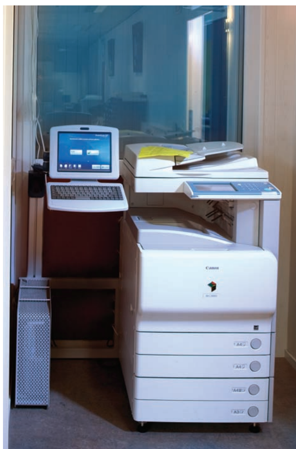
iRC2880 met eCopy ScanStation Gebruiksvriendelijk scannen van projectdocumentatie